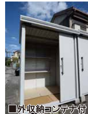
■外収納コンテナ付