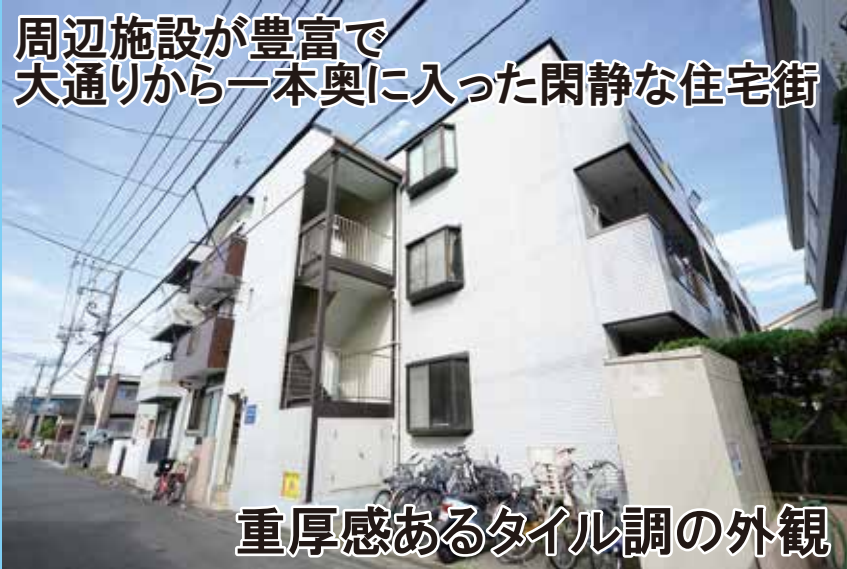
重厚感あるタイル調の外観