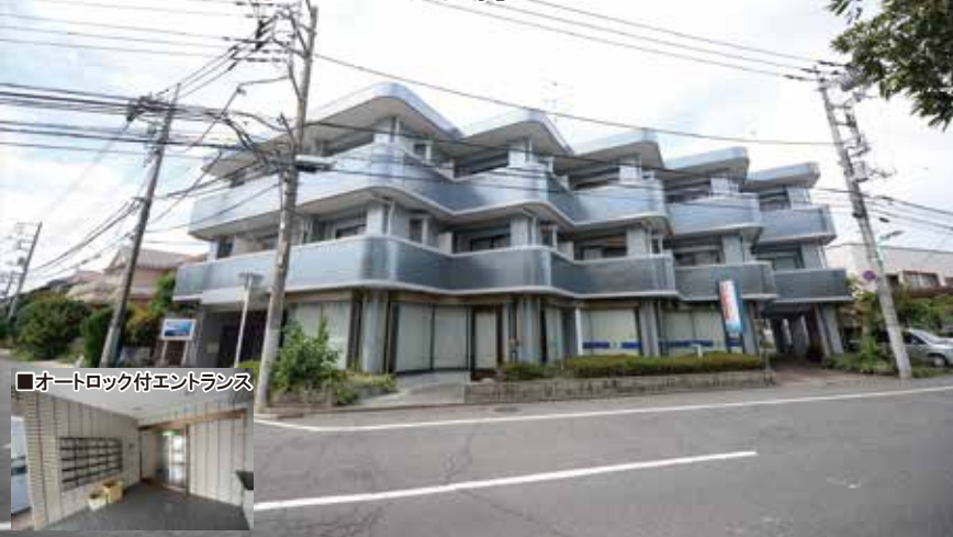
■オートロック付エントランス