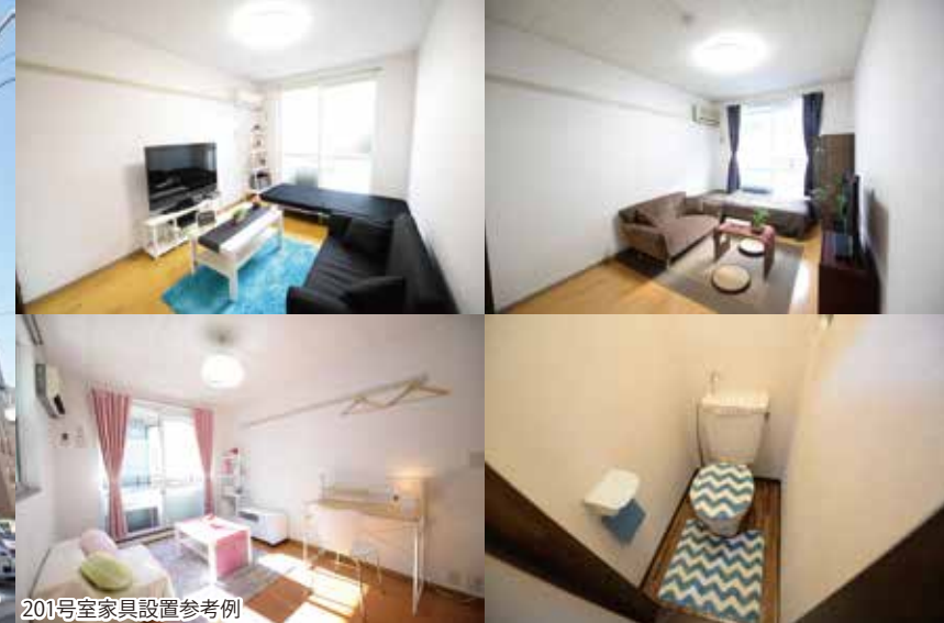
201号室家具設置参考例