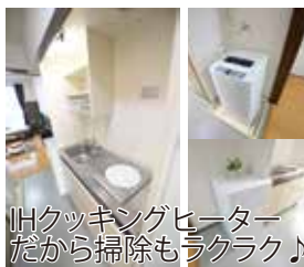
IHクッキングヒーター だから掃除もラクラク♪