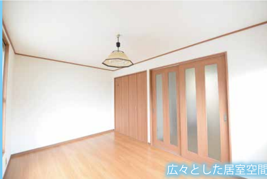
広々とした居室空間