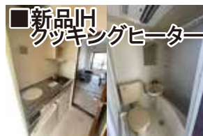
■新品IHクッキングヒーター