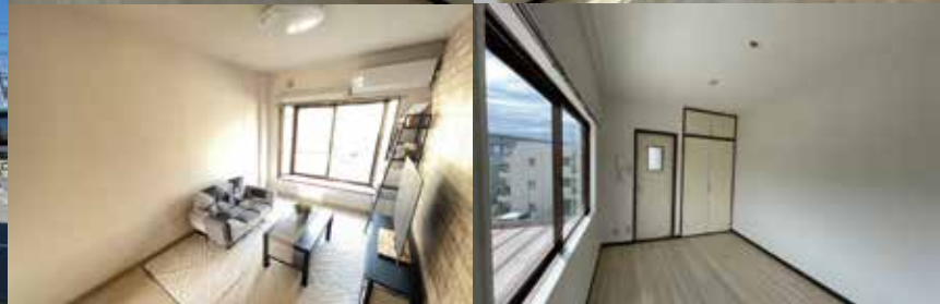
※202号室家具設置参考画像 ■LED照明設置予定